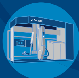
Série VMS™ DeLaval