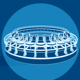
Systèmes de traite conventionnel DeLaval