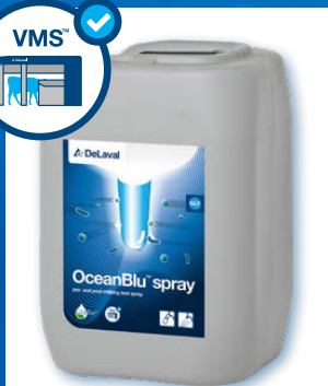
OceanBlu™ spray Pour la pulvérisation