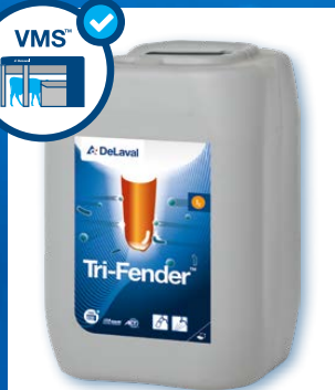
Tri-Fender™ Pour la pulvérisation