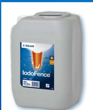
IodoFence™ Pour le trempage