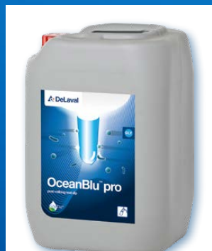
OceanBlu™ pro Pour le trempage