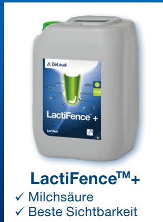
LactiFence™+ ✓ Milchsäure ✓ Beste Sichtbarkeit