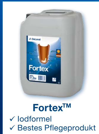
Fortex™ ✓ Iodformel ✓ Bestes Pflegeprodukt