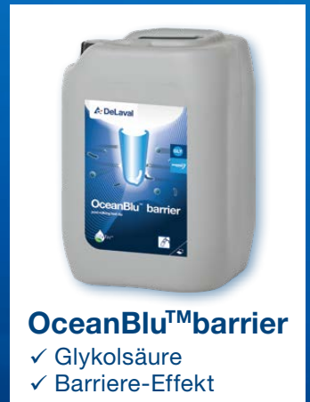
OceanBlu™ barrier ✓ Glykolsäure ✓ Barriere-Effekt

Alle Produkte sind auch für Bio Betriebe geeignet (QAV-frei). Verwenden Sie Biozide sicher. Lesen Sie vor der Verwendung immer das Etikett und die Produktinformation.