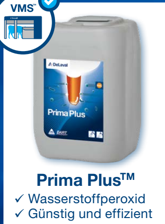
Prima Plus™ ✓ Wasserstoffperoxid ✓ Günstig und effizient