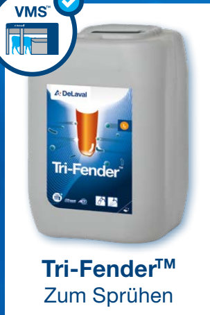
Tri-Fender™ Zum Sprühen