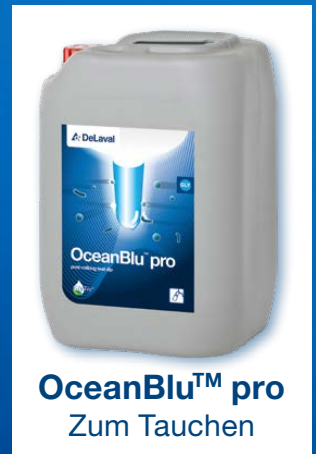
OceanBlu™ pro Zum Tauchen