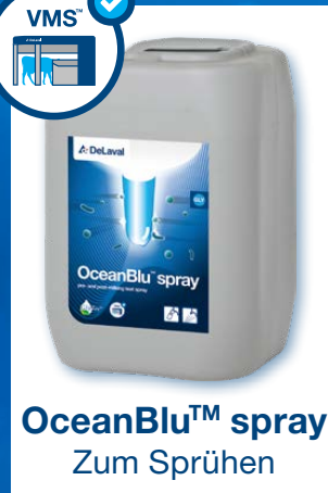
OceanBlu™ spray Zum Sprühen