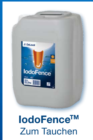
IodoFence™ Zum Tauchen