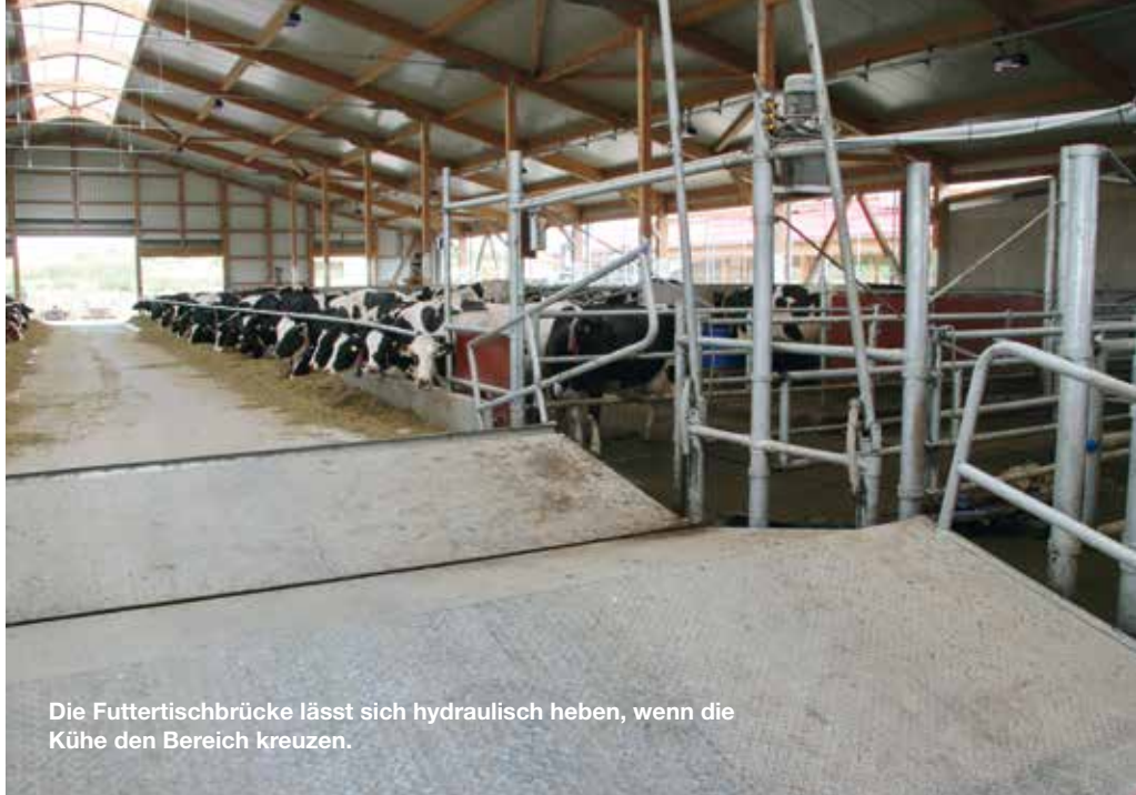
Die Futtertischbrücke lässt sich hydraulisch heben, wenn die Kühe den Bereich kreuzen.

Kirchner: Wer glaubt, mit dem automatischen Melken das