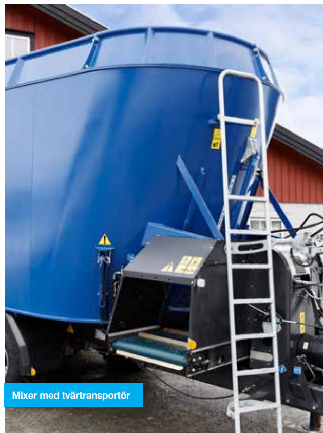
Mixer med tvärtransportör