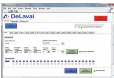
Användarvänlig programvara till din PC

DeLaval bandfoderfordelare byggs enligt ditt stalls behov. Våra erfarna distriktschefer gör behövliga måttgranskningar och planerar därefter en helhetslösning för din grovfoderkedja. Hänsyn ska tas till stallets utseende idag men även eventuella kommande förändringar. Det är även viktigt att ta hänsyn till vilket styrsystem som passar behov; vill du arbeta med vikt eller volymutfodring, göra dina inställningar