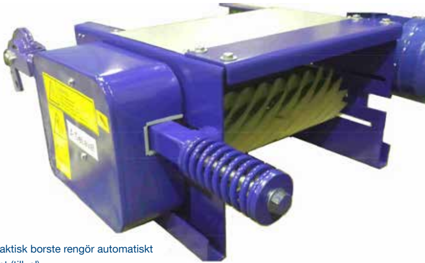
En praktisk borste rengör automatiskt bandet (tillval)