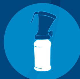
DeLaval spray- och doppningsutrustning

Vi levererar lösningar som hjälper dig att få mer mjölk av bättre kvalitet från friskare djur. Det är därför vi inte bara fokuserar på en del av mjölkningsprocessen.