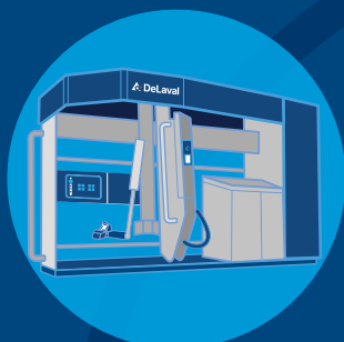
DeLaval VMS™ Serien