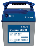
Aggregat ESE4B – Art nr 215002101