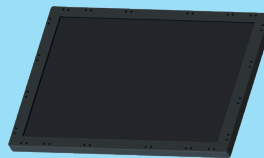
30W Solcellspanel – Art nr 2150021022