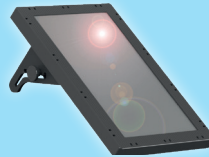
5W Solcellspanel – Art nr 2150021020