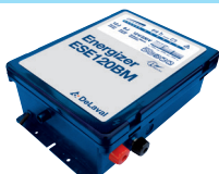
Aggregat ESE120BM – Art nr 86673601

Vi rekommenderar fritidsbatteri 12V / 85 Ah