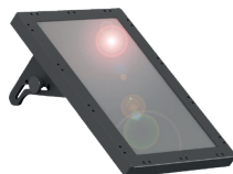
10W Solcellspanel – Art nr 2150021021