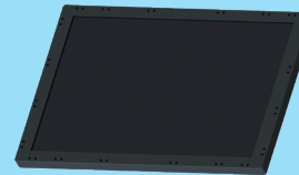
30W Solcellspanel – Art nr 2150021022