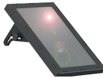
5W Solcellspanel – Art nr 2150021020