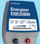
Aggregat ESE25BM – Art nr 87881201

Vi rekommenderar fritidsbatteri 12V / 85 Ah