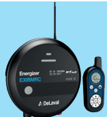
Aggregat E30BMRC – Art nr 2150041623