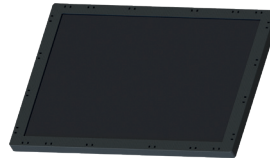
30W Solcellspanel – Art nr 2150021022