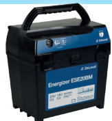
Aggregat ESE20BM – Art nr 89492401

Vi rekommenderar fritidsbatteri 12V / 85 Ah