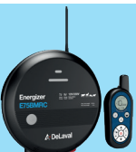
Aggregat E75BMRC – Art nr 2150041624

Vi rekommenderar fritidsbatteri 12V / 85 Ah