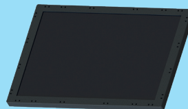
30W Solcellspanel – Art nr 2150021022