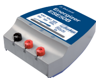
Aggregat ESE50B – Art nr 86157201

Vi rekommenderar fritidsbatteri 12V / 85 Ah