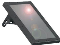
10W Solcellspanel – Art nr 2150021021