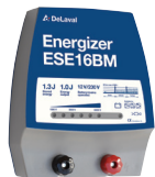
Aggregat ESE16BM – Art nr 87881301