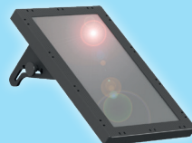
10W Solcellspanel – Art nr 2150021021