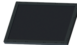
30W Solcellspanel – Art nr 2150021022