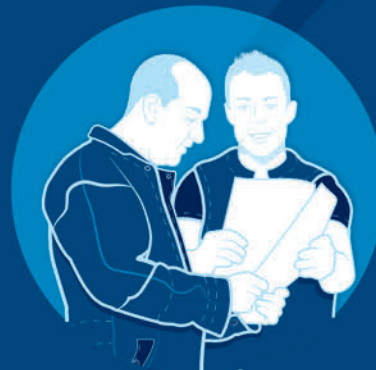
DeLaval InService™ All-Inclusive

W DeLaval dokładamy wszelkich starań, aby pomóc Ci dostarczać wysokiej jakości mleko od zdrowych zwierząt. Dlatego nie skupiamy się tylko na jednej części procesu dojenia.