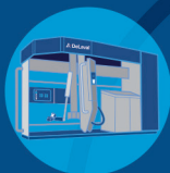
Robot udojowy DeLaval VMS™