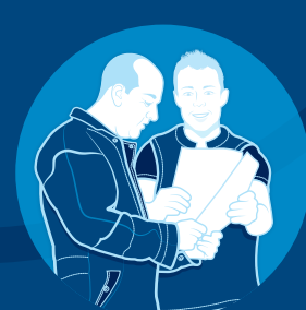
DeLaval InService™ All-Inclusive