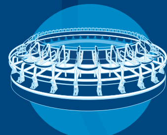
Konwencjonalne dojarnie karuzelowe DeLaval