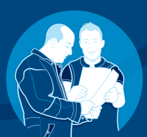
DeLaval InService™ All-Inclusive