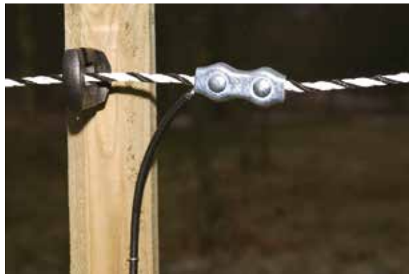
Bilde 13. Trådskjøt fra apparat til gjerde.

Voltalarmen vil nå blinke grønt når spenningen går over 2000-3000V.