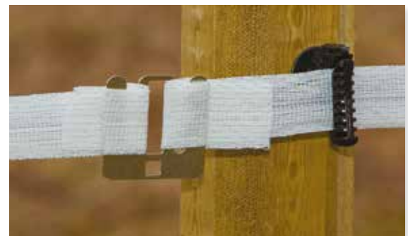
Bilde 10. Bruk bandskjøt så nær stolpen som mulig.

Hvis du må skjøte bandet fritt hengende skal det skjøtes så nær en stolpe som mulig. Ved 40 mm band; bruk bandskjøt 85030009. Til 9 - 20 mm band brukes bandskjøt 85030008, se bilde 10.