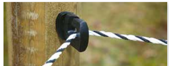
Bilde 2a. Isolatorene plasseres diagonalt på stolpen i hjørnet. Her for tråd/tau.

Monter deretter isolatorene slik at de vender inn mot beitet. I hjørnene settes isolatorene diagonalt på stolpen, se bilde 2a.