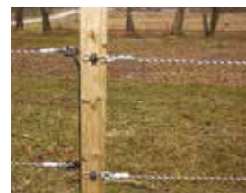
Bilde 7. Bandet kobles til grindisolatoren.