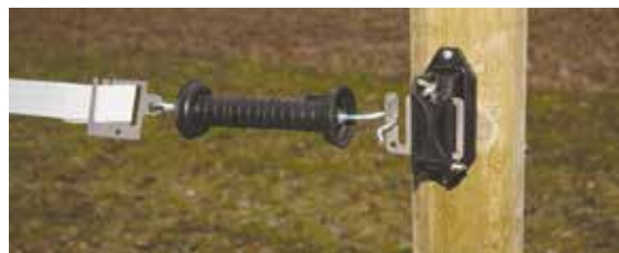
Bilde 3b. Grindisolator for band.