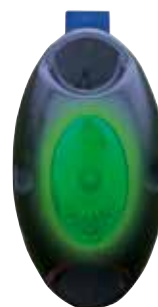
Bilde 16. Voltalarmen gir raskt signal hvis det er for høy spenning i tråden, art nr 85030002