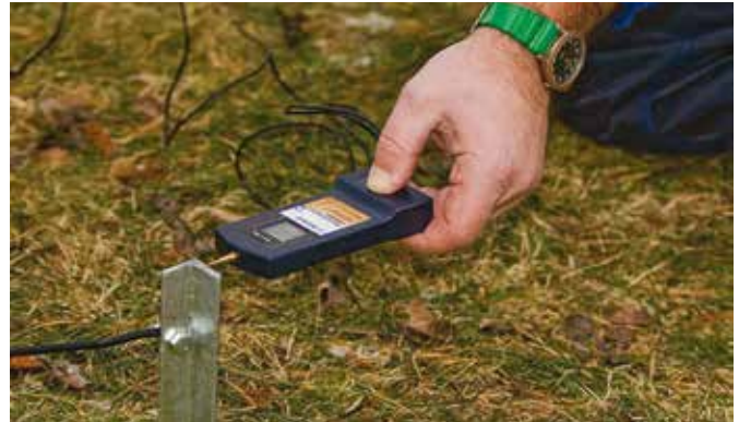
Bilde 17. Mål spenningen med DeLaval digitale voltmeter så får du sikker beskjed om alt er OK.