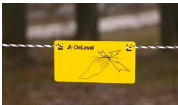
Bilde 15. DeLaval varselskilt.