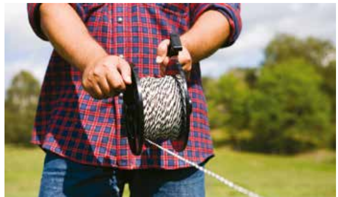
Bilde 18. Forenkler oppsetting av flyttbart gjerde

Hvis så skjer må jordingen kompletteres med flere jordspyd.