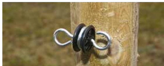
Bilde 3a. Grindisolator for tråd/tau.

Tre et rør/treskaft gjennom tråd/bandspolen når du ruller ut tråden/bandet så går det lettere.