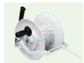
Bilde 20. Vinde med gear og trådfører. Utstyrt med automatisk låsing. Rommer ca 500 m tråd, 200 m av 12 mm polyband.