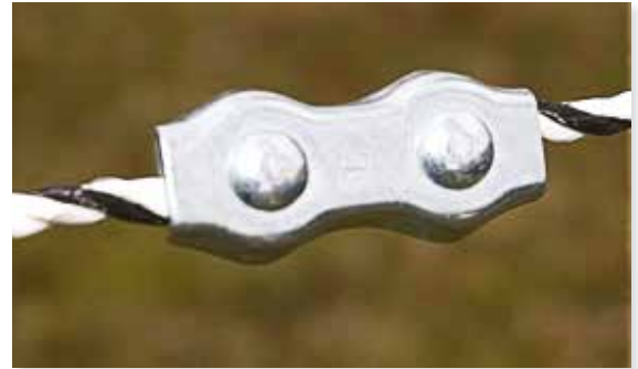
Bilde 8. Tråd og tau skjøtes med tråd-/tauskjøt.

Hvis du må skjøte tråd/tau, gjør det så nær en stolpe som mulig. Tråd og tau skjøtes med tråd-/tauskjøt 87050701 alternativt 87050702, se bilde 8.