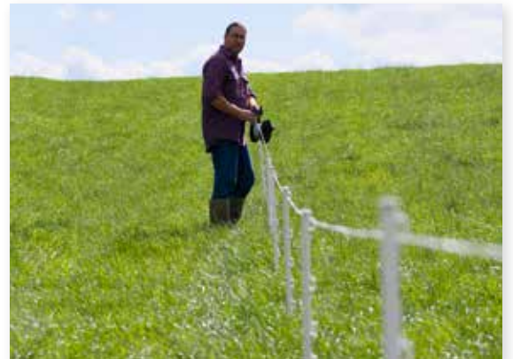
Bilde 1. Spenn en tråd mellom hjørnestolpene.

Hvis gjerdet ikke går i rett linje mellom hjørnestolpene settes stolpene etter øyemål.