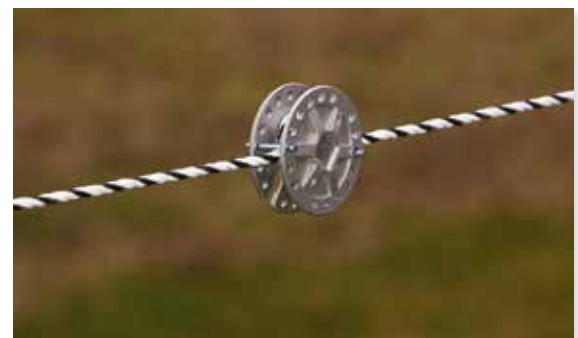
Bilde 9. Skjøt bandet med hjørneisolator og skjøteplate.

Band skjøtes best på trestolpe. Bytt ut plast-/glass-fiberstolpe til trestolpe der band skal skjøtes. Skjøt bandet med hjørneisolator og skjøteplate, se bilde 9.