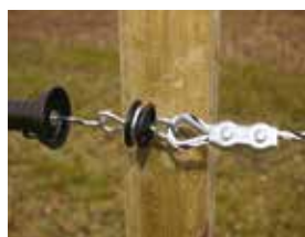
Bilde 6. Bruk kaus og trådskjøt med vingemutter ved tråd/tau.