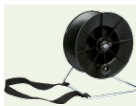
Bilde 19. Kombivinde. En lettvektsvinde som forenkler opprulling og uttrekking av polytråd og band.

DeLaval Vinde med gear og trådfører 98767206 rommer ca 500 m tråd alt. 200 m 12 mm band.