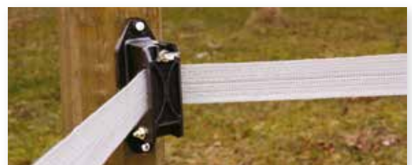
Bilde 2b. Med band, monter hjørne-/endeisolator i hjørnene.

Hvis du skal ha band monteres alltid hjørne-/sluttisolator 90632031 i hjørnene, se bilde 2b.