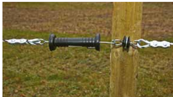
Bilde 4. Grindhåndtak for tråd/tau.