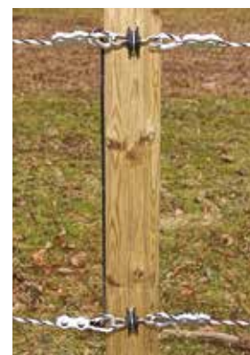
Bilde 11. Tråd/tau kobles med strømforsyningskabel og trådsjøt.

Band settes sammen med tilkoblingskabel 90632016, se bilde 12.