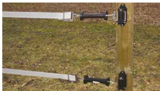
Bilde 5. Grind- og skjøteplate til grindisolator for band.