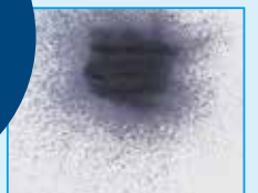
VMS™ V300 spray