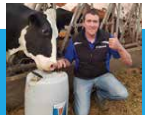
L. Leleux, België

“Ik ben erg tevreden over Tri-Fender in mijn VMS™ robot, de spenen zijn zacht en zien er goed uit. Melkkwaliteit en uiergezondheid zijn erg belangrijk voor ons en Tri-Fender draagt bij aan goede resultaten. Het is een rendabele investering en geeft zekerheid.” **