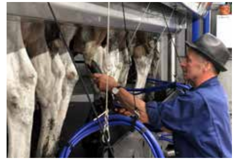
La traite douce avec les faisceaux Evanza

« Les vaches n'ont eu pratiquement aucune infection des mamelles depuis la transformation. Je crois que c'est grâce aux faisceaux. Fantastique ! Il suffit de les accrocher, de traire et hop - c'est fait ! Il ne faut presque jamais revenir pour corriger, même avec mon cheptel dont les mamelles sont fort différentes l'une de l'autre. La nouvelle salle de traite a été un grand investissement, mais de cette façon, je peux continuer le travail jusqu'à la retraite. » dit Bouwe, avec un grand sourire.