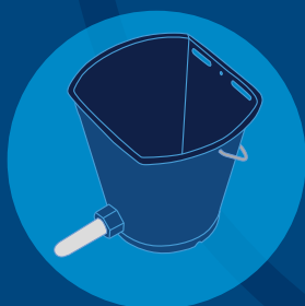
„DeLaval“ veršelių šėrimo kibirėlis su žinduku