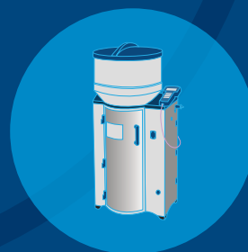
„DeLaval“ veršelių šėrykla

Mes siūlome sprendimus, padedančius jums primelžti daugiau kokybiškesnio pieno iš sveikesnių gyvulių.