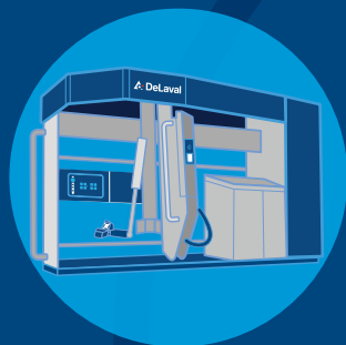
„DeLaval“ VMS™ V300

„DeLaval“ mobilieji veršelių šėrimo įrenginiai puikiai veikia naudojant kartu su: