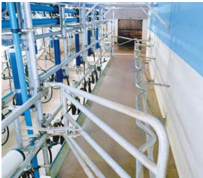
La contention arrière et la contention avant assurent une entrée régulière dans la salle de traite.