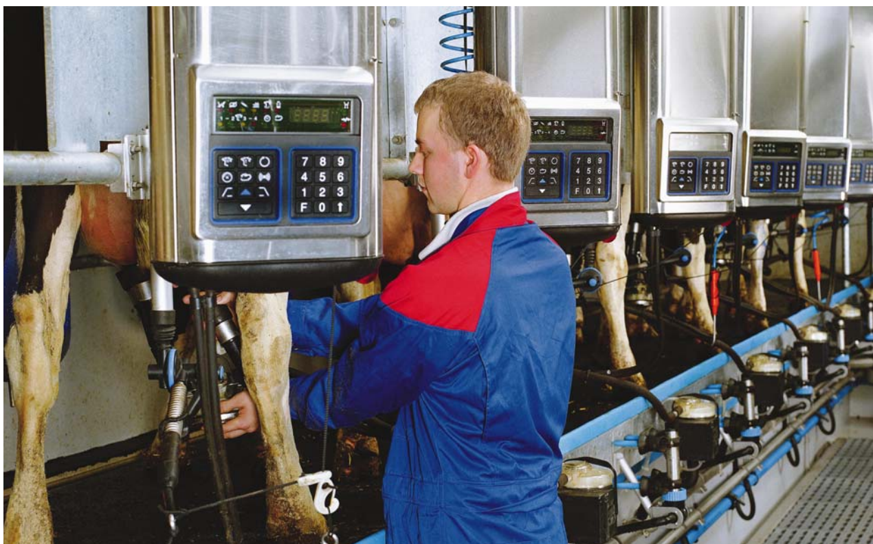
Traite plus confortable et facilitée.

Les portes d'entrée de la salle de traite en épi 30° DeLaval sont robustes et actionnées par des vérins alimentés par le système de vide. Ce dispositif permet une circulation régulière des vaches. Les portes peuvent être contrôlées depuis n'importe quel point de la salle de traite par une simple pression sur un bouton (option pilote de traite ALPRO®).