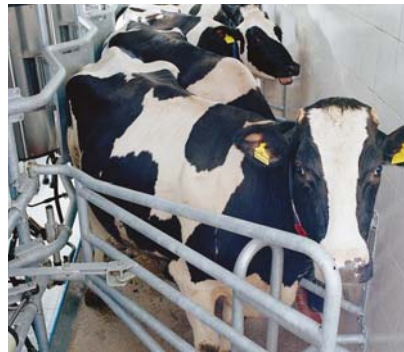
La salle de traite en épi 30° DeLaval garantit une bonne position des vaches pendant la traite.