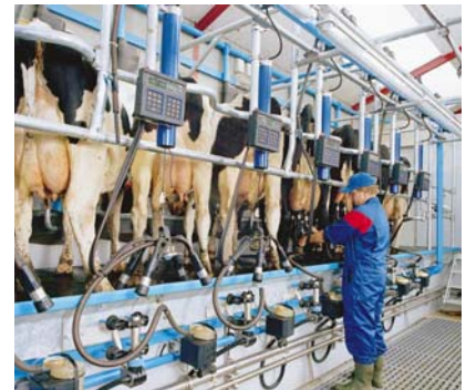
Traite efficace et confortable.

De larges passages permettent aux vaches de circuler aisément. La dernière vache est délicatement poussée à sa place dans la stalle lorsque la porte d'entrée se ferme. L'angle de la porte de sortie de la salle de traite en épi 30° DeLaval permet de bien aligner la première vache lors de son entrée et de la faire sortir rapidement. Celle-ci quitte la salle de traite sans aucune hésitation, réduisant à un minimum le temps nécessaire au changement de lot.