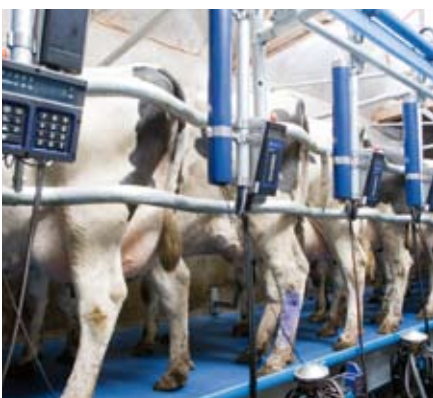
Lice arrière sinusoidale / barre anti-coups de pattes de 2"

Dans une salle de traite en épi 50°, la distance entre les vaches étant plus courte que dans une salle de traite en épi 30° traditionnelle, les déplacements du trayeur sont réduits. Pour une longueur de fosse identique, il est possible de placer plus de vaches. Traire par l'arrière avec une barre anti-coups de pattes améliore grandement la sécurité du trayeur. Nos nouveaux modules standard sont dorénavant disponibles avec, en option, un pare-bouses par place pour offrir une vue plus dégagée sur les vaches tout en protégeant le trayeur et les équipements pendant la traite.