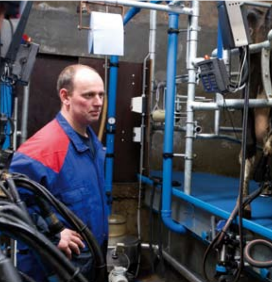
Lice arrière sinusoidale et barre anti-coups de pattes