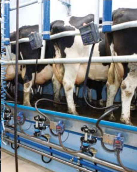
Positionnement excellent de l'animal