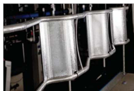
Arceau en S avec pare-bouse

Les lices avant peuvent être remplacées sur demande par une rangée de mangeoires. Les mangeoires individuelles sont séparées pour empêcher les vaches de voler la nourriture de leurs voisines et garantir que la traite se déroule dans le calme et sans stress. Le système de gestion du troupeau DeLaval détermine la ration individuelle par animal.