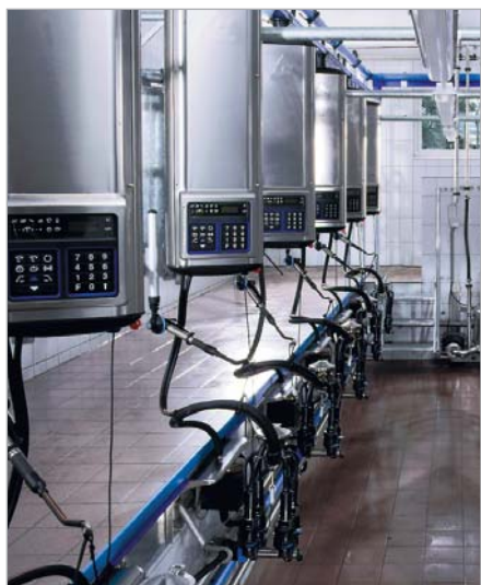
Epi 30° avec unité trayeuse MP700

Grâce à notre grand choix de dispositifs de traite automatiques, vous pouvez sélectionner vous-même l'équipement dont vous avez besoin pour votre exploitation en collaboration avec votre concessionnaire.