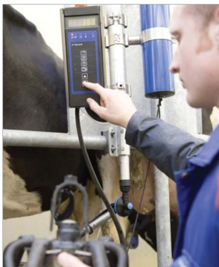
Facilité d'accès des dispositifs automatiques (MPC510)

La nouvelle génération des salles de traite en épi 30° de DeLaval se caractérise par une meilleure position des vaches, par un meilleur confort pour l'animal et pour l'homme et par une grande durée de vie.