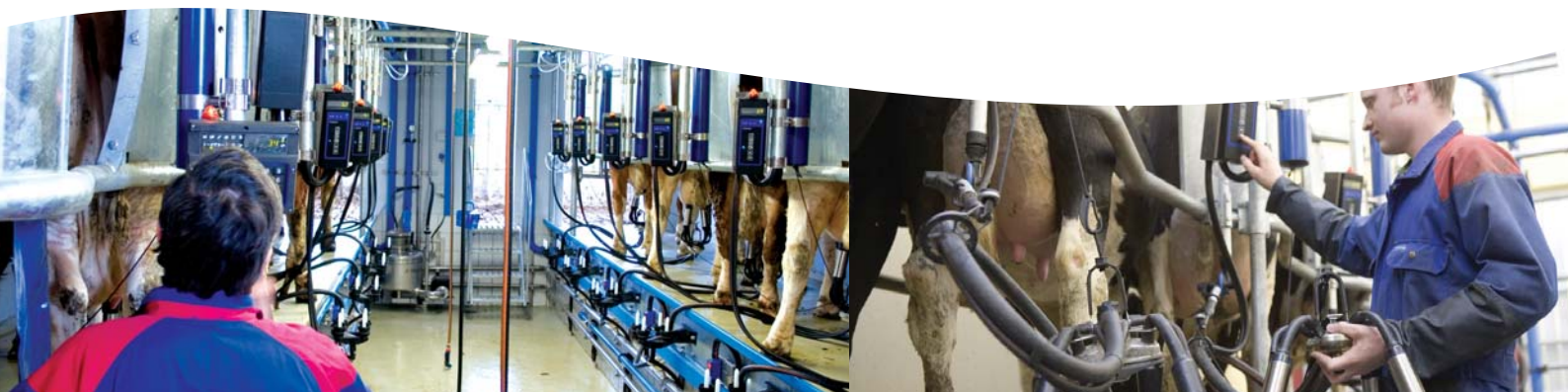
Aire de travail spacieuse