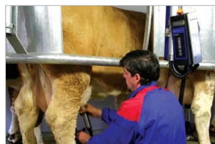
Déplacement réduit jusqu'au pis

Toutes les lices arrière, qu'elles soient de types droite ou sinus, avec ou sans pare-bouses, sont décalées. Elles s'adaptent à l'anatomie naturelle de la vache, sans aucune pression sur les zones sensibles. Choisissez le type de lice arrière et le type de lice avant les plus adaptés à votre troupeau. DeLaval vous offre également un grand choix de solutions : barre frontale en Z, épi Flex, système d'indexation modulable ou fixe, mangeoires ou sortie frontale.