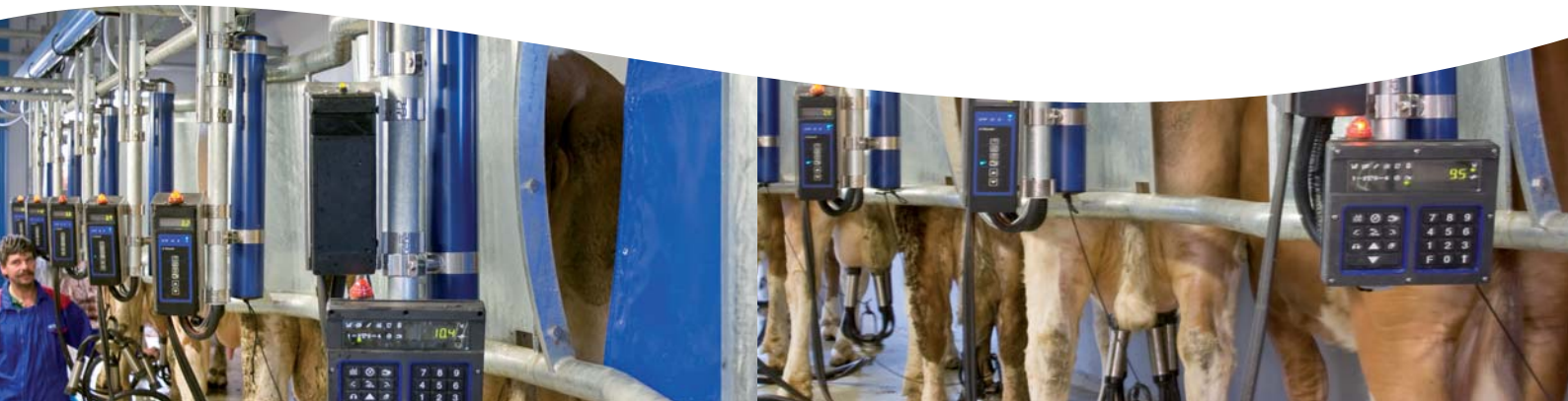
Salle de traite épi 30° équipée de MPC510/610