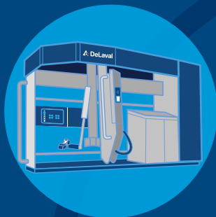
DeLaval VMS™ Serie