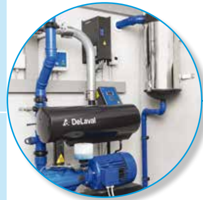
DeLaval NFO -taajuusohjattu tyhjäpumppu