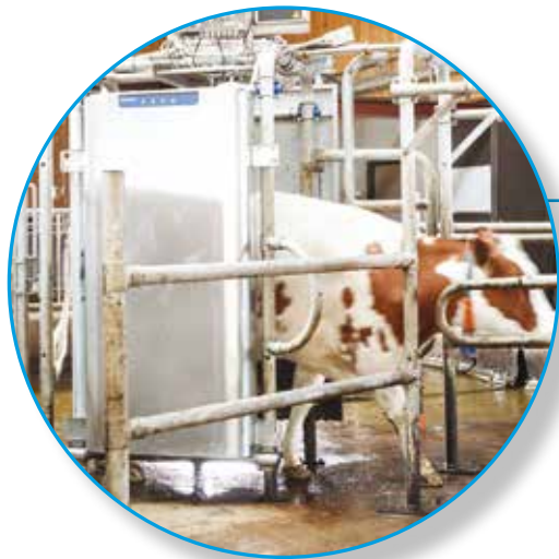
Lehmien tunnistus ja erottelu