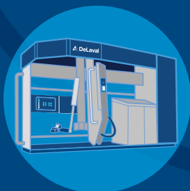
Série VMS™ DeLaval