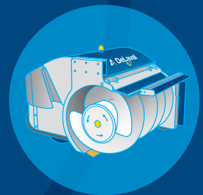
DeLaval OptiDuo™ rehunsiirtäjä

Laita DeLaval keräävä lantarobotti töihin puolestasi.