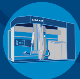
DeLaval VMS™ -sarja