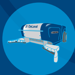
Robots racleurs DeLaval