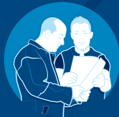
DeLaval InService™ All-Inclusive

Même après le lancement, nous nous chargeons avec InService All-Inclusive d'un schéma d'entretien fixe, ainsi que des conseils et de l'accompagnement nécessaires pour que votre investissement ait le rendement optimal.