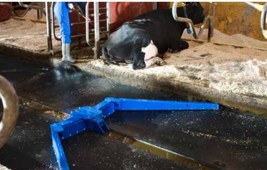
DeLaval vajerkrapa ACC