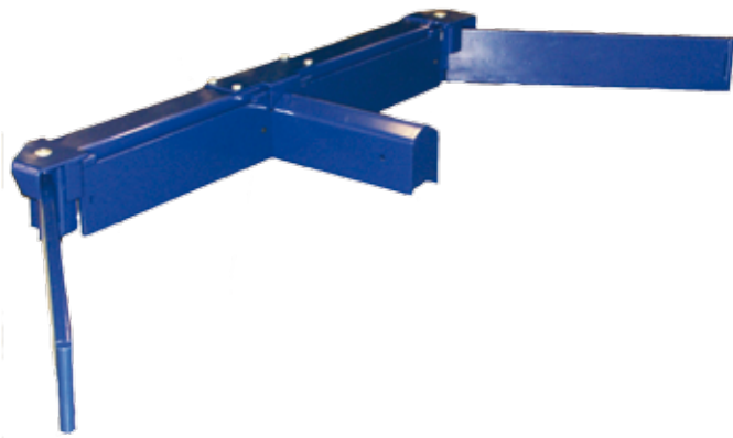
DeLaval vajerkrapa CSL