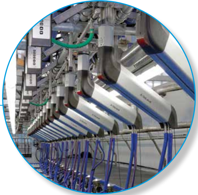
DeLaval Swing-Arm MSA30