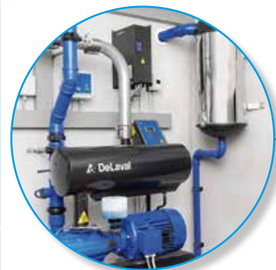
Vakuumpumpen mit NFO Frequenzsteuerung