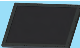
30W Solcellspanel Art nr 2150021022