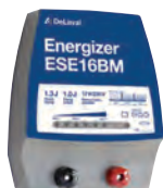
Aggregat ESE16BM – Art nr 87881301