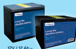
12V / 12 Ah – Art nr 90632090 och 9V / 175 Ah – Art nr 88029101