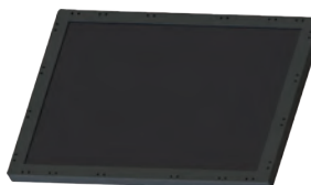
30W Solcellspanel Art nr 2150021022