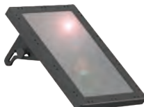
10W Solcellspanel – Art nr 2150021021