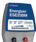
Aggregat ESE25BM – Art nr 87881201

Vi rekommenderar fritidsbatteri 12V / 85 Ah