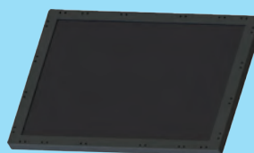
30W Solcellspanel Art nr 2150021022