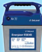
Aggregat ESE4B – Art nr 2150020131