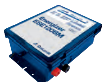
Aggregat ESE120BM – Art nr 86673601

Vi rekommenderar fritidsbatteri 12V / 85 Ah