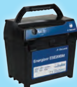
Aggregat ESE20BM – Art nr 89492401