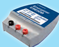
Aggregat ESE50B – Art nr 86157201

Vi rekommenderar fritidsbatteri 12V / 85 Ah