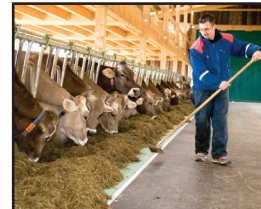
Lätt att hålla ren