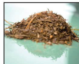
Ger kvalitetsfoder och hög mjölkproduktion