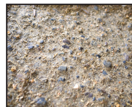
Bakterierisk på betong