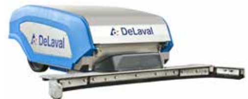
DeLaval robotskraper for spaltegulv RS450S med vannspyling