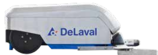
DeLaval robotskraper for spaltegulv RS450S

De største fordelene med å regelmessig fjerne gjødsel fra spaltegulv er at det gir bedre hygiene og bedre klauvhelse. Mange foretrekker en robotsystematisk rengjøring av spaltearealet fremfor et fast skrapesystem; hvert område blir rent til rett tidspunkt. Det dyrevennlige gjødselrobotsystemet fungerer også i alle typer planløsninger og er lett å tilpasse når du vil gjøre endringer i kjøreskjemaet.