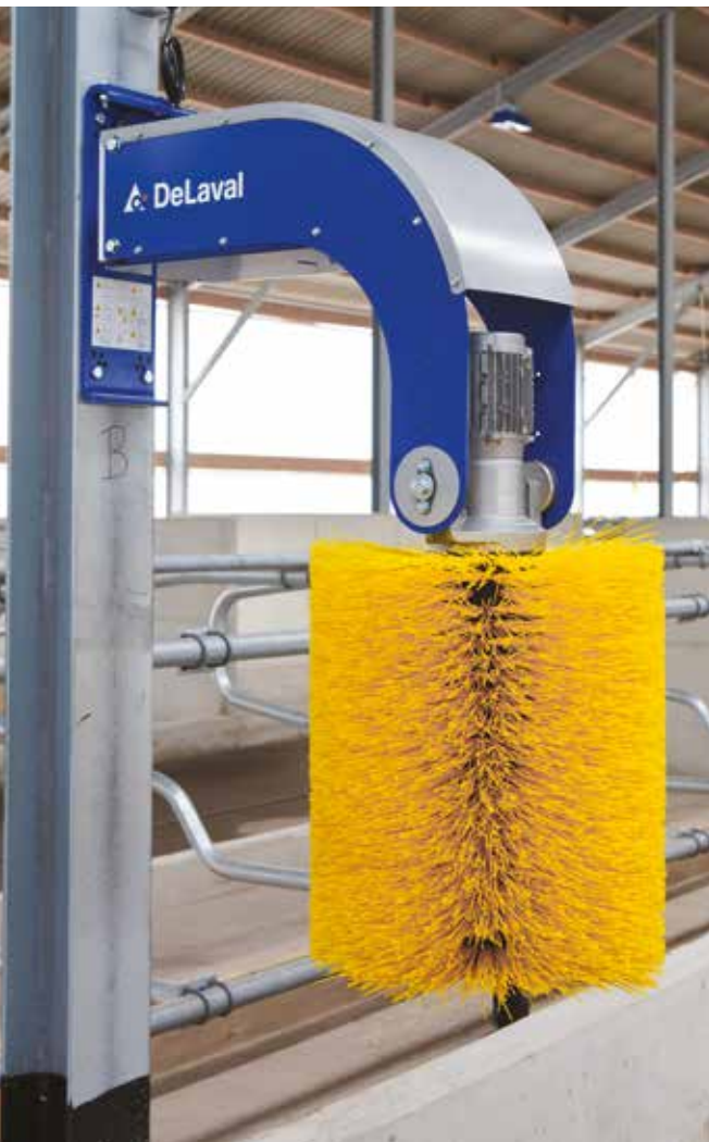
Utskiftbar blå børste, eksentrisk utfornet.