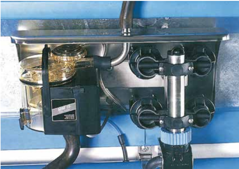
DeLaval Milchmengenmessgerät MM15