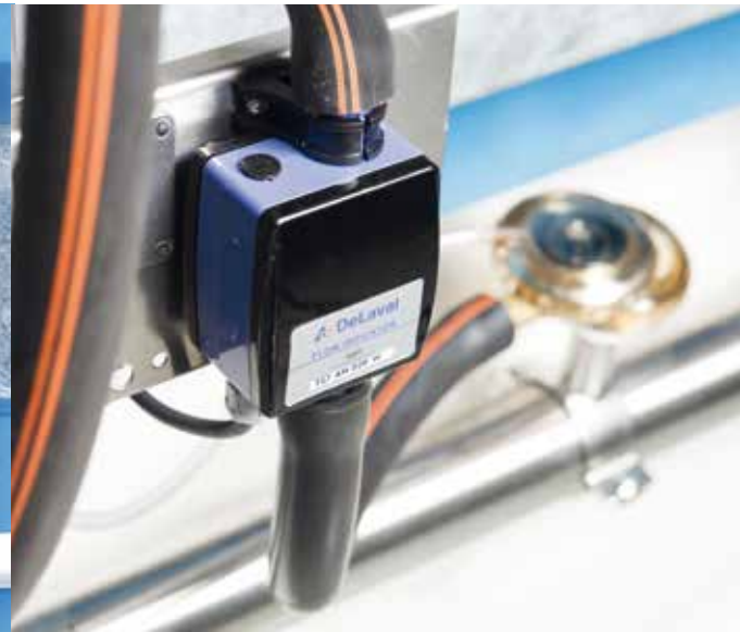
DeLaval Milchmengenanzeige FI7