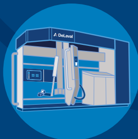
DeLaval VMS™ Serie