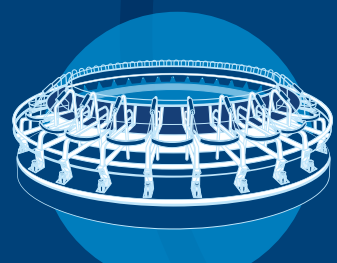
DeLaval konventionelle Melksysteme