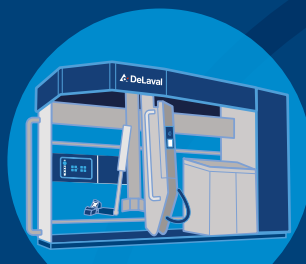
DeLaval VMS™ Serie