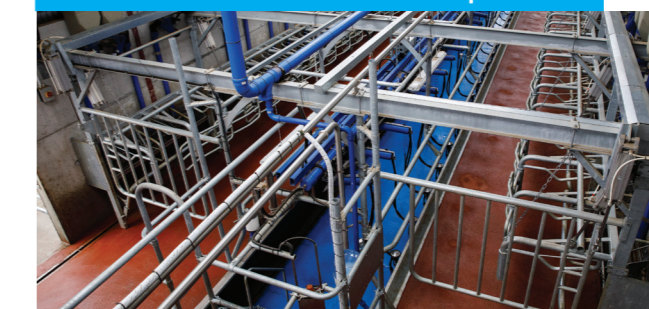
Dessin modulaire – 1x3 to 2x40 disponible*

La TPA P100 DeLaval est construite par module de trois ou quatre places qui s'assemblent les uns aux autres pour atteindre de 3 à 40 places par côté et donc de s'ajuster à la taille qui convient à votre exploitation. La P100 rend possible d'augmenter la vitesse de traite dans le confort au sein d'un projet en neuf ou d'un bâtiment existant.