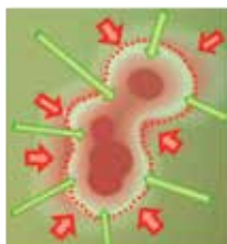
Grâce au brevet LactySin, attaque de la membrane des bactéries pour laisser pénétrer l'acide lactique