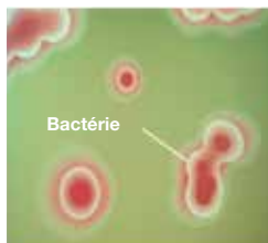
Bactéries responsables des mammites

➔ Acide lactique qui pénètre la bactérie