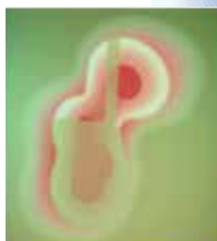
Grâce au LactySin, l'acide lactique agit au cœur de la bactérie pour une meilleure désinfection