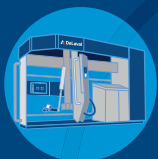
DeLaval VMS™ V300