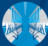
Salles de traite DeLaval