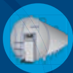
Tanks à lait DeLaval