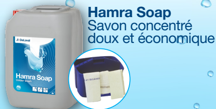
Hamra Soap Savon concentré doux et économique