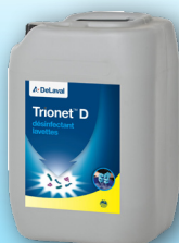
Trionet™ D Désinfectant lavettes