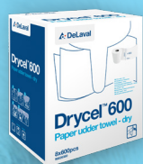
Drycel™ 600 Lingettes à imbiber