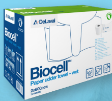
Biocell™ Lingettes désinfectantes prêtes à l'emploi