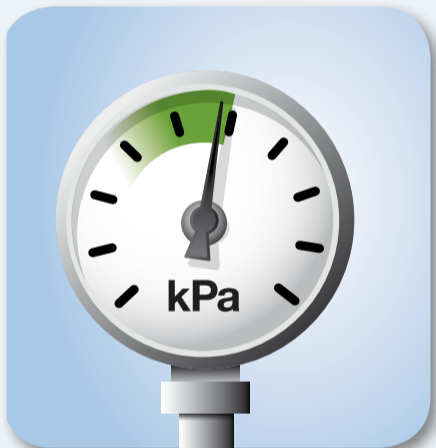
5. Zkontrolujte dojící podtlak