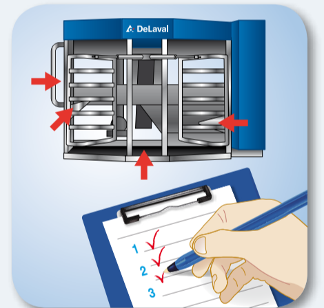
8. Zkontrolujte nastavení VMS