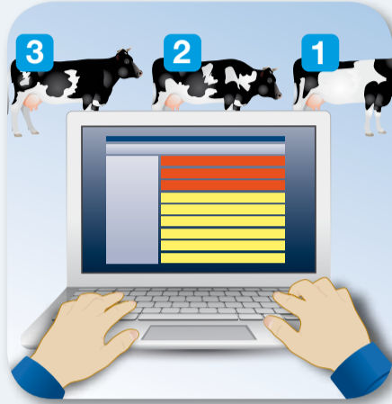
2. Monitorujte interval dojení