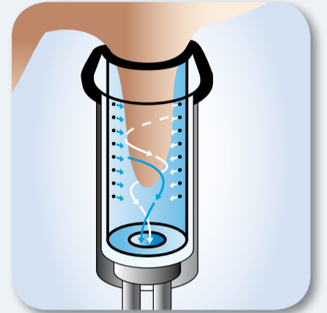
4. Zajistěte účinnou přípravu struku