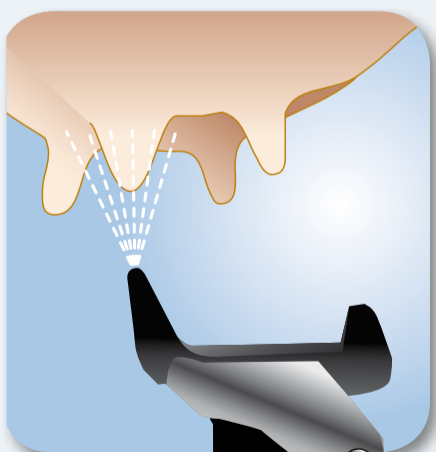
9. Zabraňte rozšíření infekce po dojení