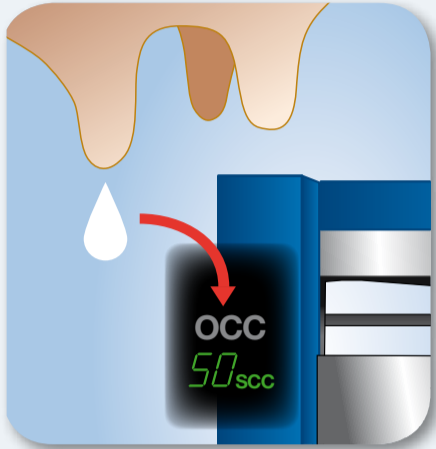
1. Pravidelně monitorujte zdravotní stav vemene