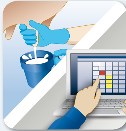
3. Zkontrolujte jednotlivé čtvrtě