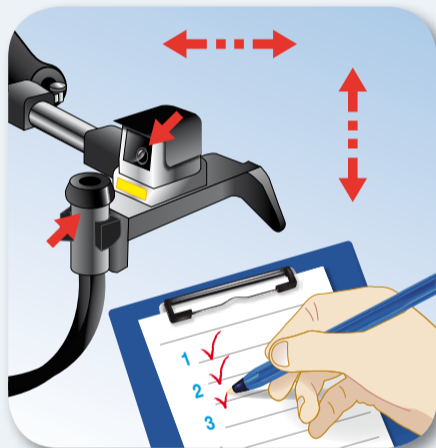
6. Zkontrolujte nasazování při dojení