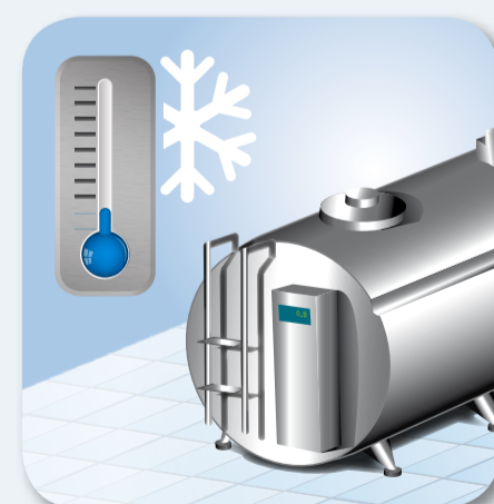
11. Mléko okamžitě zchladte