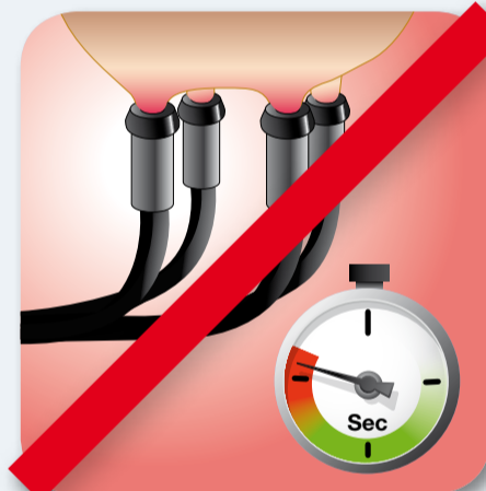
7. Zabraňte předojení nebo nedododování