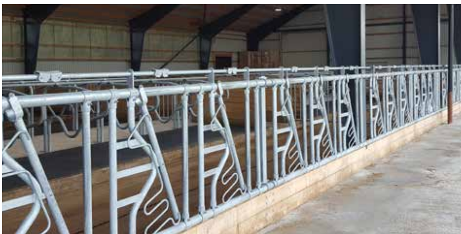
Låsbara säkerhetsfronter längs hela foderbordet underlättar djurskötsel.

– Projektet gick smidigt och jag är nöjd med resultatet. Här kan jag driva en effektiv verksamhet, avslutar Tobias.