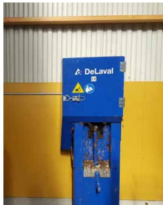
Utgödslingen är en AKD kättingutgödsling som kan köras både automatiskt och manuellt. Den kraftiga kättingen är mycket hållbar.