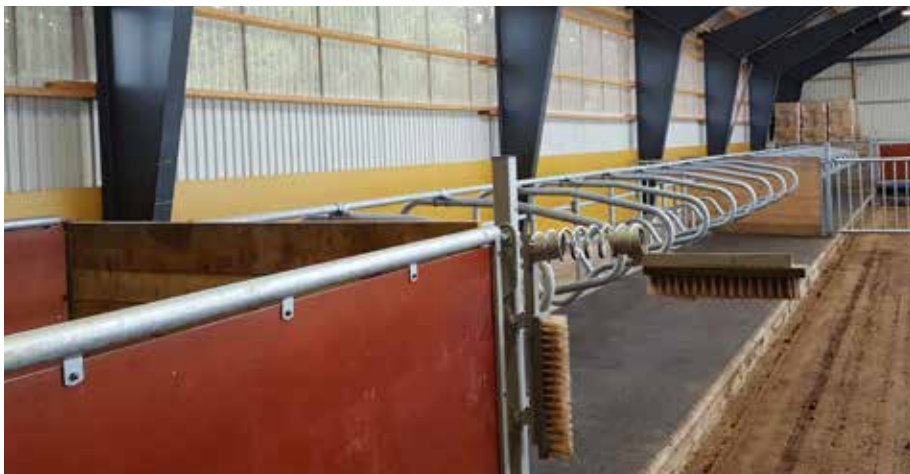
Kalvboxen i bildens framkant är en av sex likadana. Liggbåsen har bra mattor