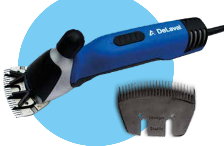
Skär 97106455 passar bäst till köttdjursklipping

Levereras med 3" skär. Komplettera med skäret här till höger som är bäst om du vill klippa köttdjur.