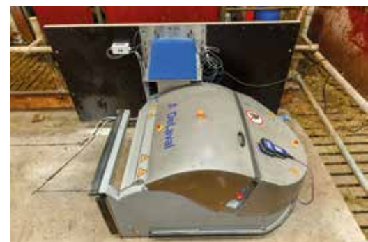
DeLaval OptiDuo™ i sin laddningsstation.

OptiDuo har en gummilist som tätar ned mot foderbordet för att hålla så bra hygien som möjligt. OptiDuo laddas alltid automatiskt mellan sina körningar för att alltid ha full kraft under körningarna.