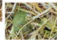
1 dag efter dosering