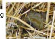
3 dagar efter dosering