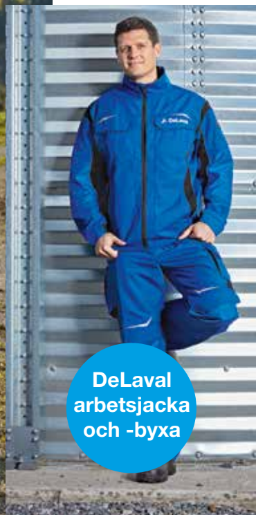
DeLaval arbetsjacketta och -byxa