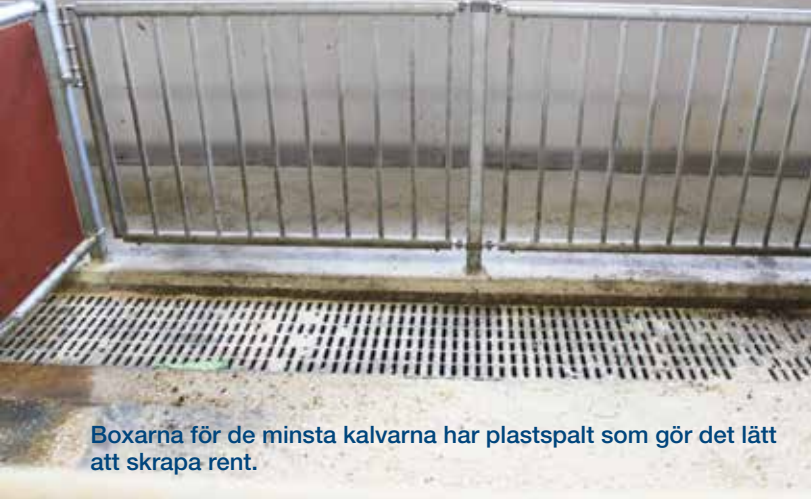
Boxarna för de minsta kalvarna har plastspalt som gör det lätt att skrapa rent.