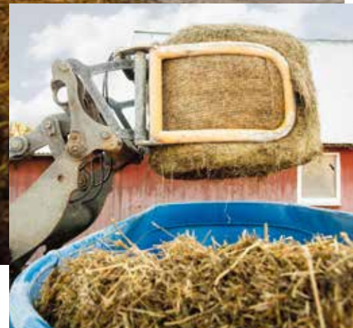
Den mobila mixern tar hela rundbalar.