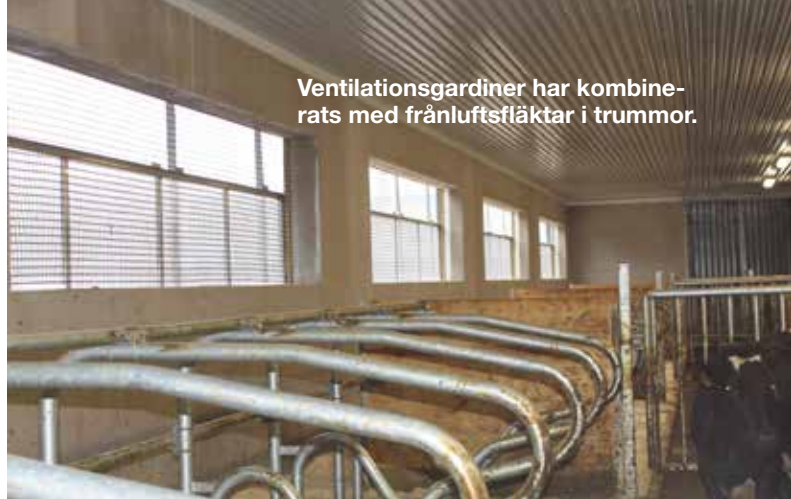
Ventilationsgardiner har kombinerats med frånluftsfläktar i trummor.

strömskena längs hela foderbordet. På sidan med ungnötsgrupper, utfodras det längs hela längden och på den andra sidan har markörer satts upp så att det utfodras precis vid varje öppning i kalvboxarna.